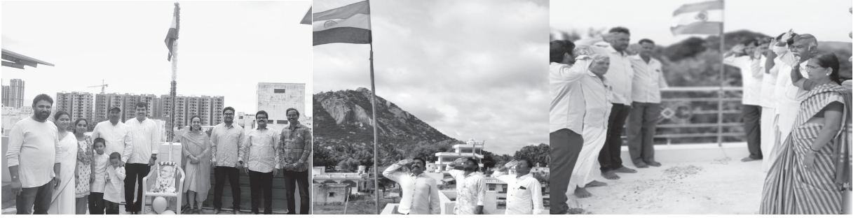
హైదరాబాదులోని ఏపిమాన్ ప్రధాన కార్యాలయం, గుడిబండ, నల్లమాడ