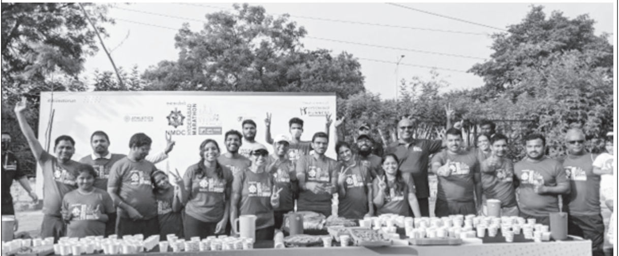
ఒకరిని అంచనావేయడం వల్ల వారెలాంటివారో తెలిసే కన్న నీవెలాంటివాడివో తెలుస్తుంది.