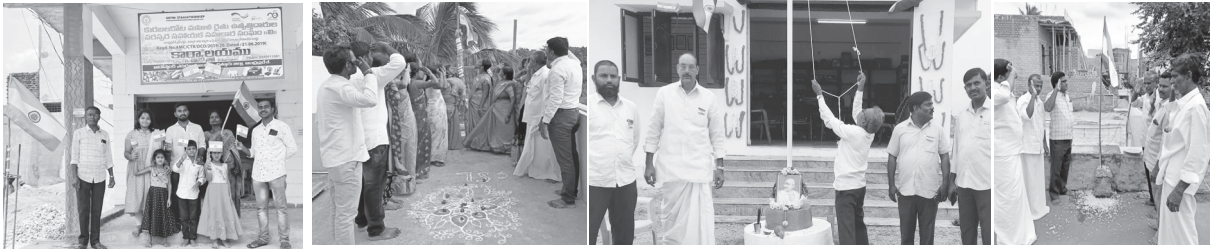
కురబలకోట, పెద్దవడుగూరు, బోరపట్ల, తాడిపత్రి