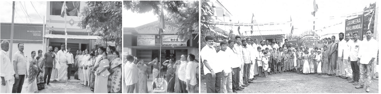
పామిడి, వాల్మీకిపురం, జి ఎం ఎం-భీశాలి