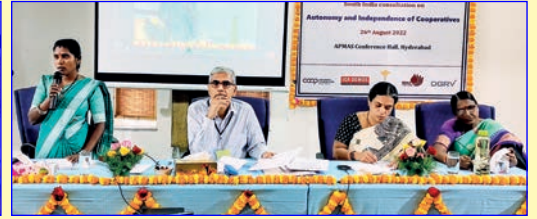
దక్షిణాది సహకార సంస్థల పరిస్థితి పై చర్చాగోష్టి ... మలకొన్ని దృశ్యాలు