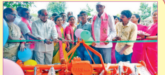
ఏ ఆర్ వల్లి ఎఫ్ పి ఓలో కస్టమ్ హైలెండ్ సెంటర్ను ప్రారంభిస్తున్న ఎం ఎల్ ఏ

బట్వాడా కాకపోతే దయచేసి ఈ చిరునామాకు తిప్పిపంపండి