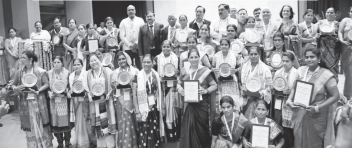
ఇది 2022 లో ఉత్తమ ఎస్ హెచ్ జి సమాఖ్యలకు పురస్కార ప్రదానోత్సవ దృశ్యం

ఏపిమాస్ , ఎనేబుల్ నెట్ వర్క్ సంయుక్తంగా నాబార్డు తోడ్పాటుతో 2021వ సంవత్సరంలో ఎస్ హెచ్ జి సమాఖ్యలకు జాతీయ పురస్కారాలను ప్రవేశపెట్టాయి. భారతదేశంలో నిర్వహణపరంగా అత్యుత్తమ ఎస్ హెచ్ జి సమాఖ్యలను గుర్తించి, గౌరవించాలన్న లక్ష్యంతో ఈ పురస్కారాలు ఏర్పాటు చేశారు. ఈ సంవత్సరం కూడా ఏపిమాస్ సంస్థ, ఎనేబుల్ నెట్ వర్క్ సంయుక్తంగా డి.జి.ఆర్.వి, యన్.బి.ఐ, యఫ్.డబ్ల్యు.డబ్ల్యు.బి, ప్రాదాన్ సంస్థల తోడ్పాటుతో ఎస్ హెచ్ జి సమాఖ్యలకు తృతీయ వార్షిక పురస్కారాలను అందజేయడానికి రంగం సర్వం సిద్ధమైంది.