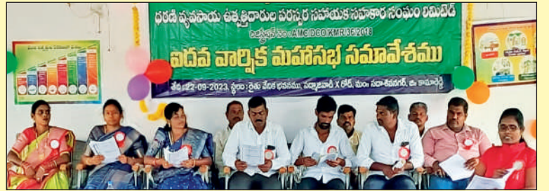
ధరణి ఎఫ్ పి ఓ