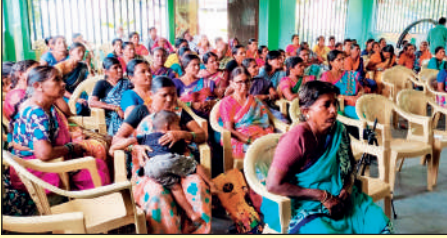
ఆజీవ ఎఫ్ పి ఓ ...