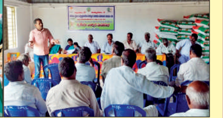
సోమల ఎఫ్ పి ఓ