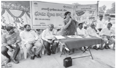
పత్తి నూనె కేంద్రానికి ప్రారంభోత్సవం ... ఎస్ ఎల్ డి పి యూనిట్ల పంపిణీ ... గ్రామీణ సంత (రూరల్ హాట్) కు భూమి పూజ

పని భారానికి ఆసక్తి కొలమానం; ఆసక్తి వుంటే కష్టమైనా సులువే, అదే లేకుంటే సులువైనా కష్టమే