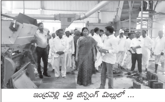
ఇంద్రవెల్లి పత్తి జిన్నింగ్ మిల్లులో ...

ఉత్పారు మండలంలోని 11 గ్రామాలకు చెందిన 28