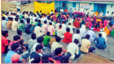
భూసంపద ఎఫ్ పి సి ... ఎమ్మిగనూరు రైతుస్వరాజ్యం ఎఫ్ పి సి ... పెండ్లిమర్రి ఎఫ్ పి ఓ