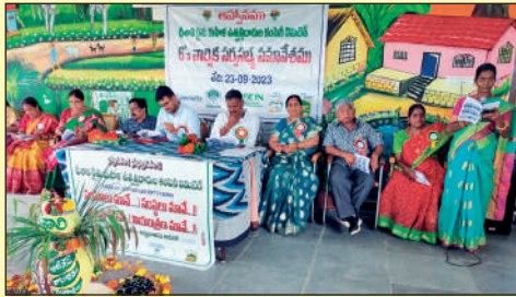
ధీశాలి ఎఫ్ పి సి ...