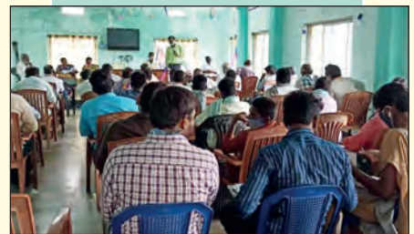
గోనెగండ్ల ఎఫ్ పి సి