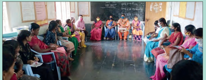
జి ఎం ఎస్ వర్క్ షాప్ . . . చంద్రుగొండలో ఎస్ వి ఇ పి- సిఆర్పి- ఇ పి లకు శిక్షణ

బట్వాడా కాకపోతే దయచేసి ఈ చిరునామాకు తిప్పిపంపండి