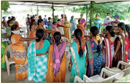
ఆజీవ ఎఫ్ పి టి వార్షిక సర్వసభ్య సమావేశం