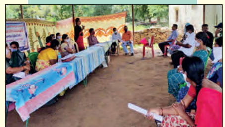
బొల్లవరం ఎఫ్ పి టి