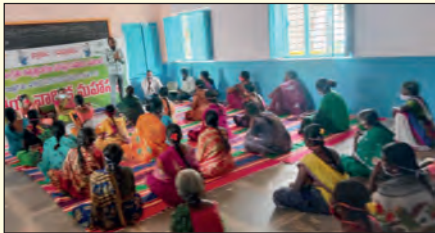
భూమాత ఎఫ్ పి టి వార్షిక సర్వసభ్య సమావేశం