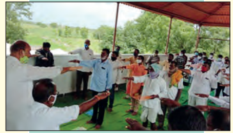
జైకిసాన్ ఎఫ్ పి టి