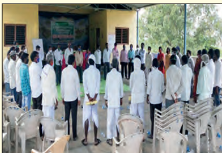
ధరణి ఎఫ్ పి టి వార్షిక సర్వసభ్య సమావేశం