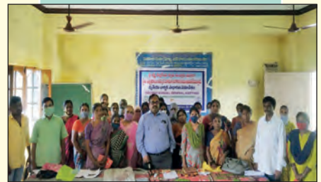
మిడ్తూరు ఎఫ్ పి టి