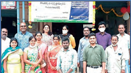
వి కోట, పలమనేరులలో ఎఫ్ డి సి ల ప్రారంభోత్సవ దృశ్యాలు