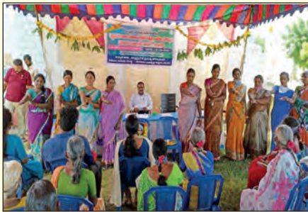
పెద్దవడుగుూరు ఎఫ్ పి టి వార్షిక సర్వసభ్య సమావేశం