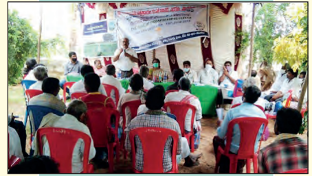
ఎమ్మిగనూర్ ఎఫ్ పి సి