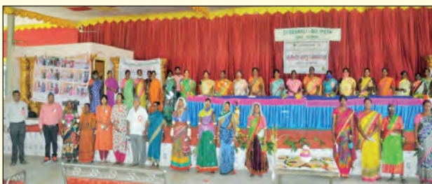
భీశాలి ఎఫ్ పి సి వార్షిక సర్వసభ్య సమావేశం