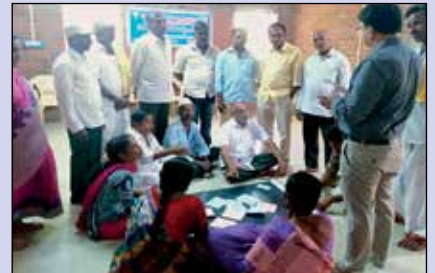
పీలేరు ఎఫ్ పి ఓ డైరెక్టర్ల సమావేశం

బట్టాడా కాకపోతే దయచేసి ఈ చిరునామాకు తిప్పింపండి