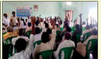
గుంతకల్లు ఎఫ్ పి సి డైరెక్టర్ల సమావేశం