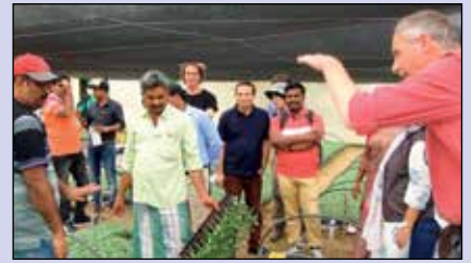
చిత్తూరు జిల్లా రామసముద్రం మండలంలో జి ఐ జిడ్ పరిశీలకుల బృందం పర్యటన