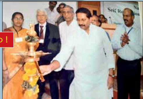
'మాన్' సదస్సులో మాజీ ముఖ్యమంత్రి శ్రీ కిరణ్ కుమార్ రెడ్డి తో పాటు ...