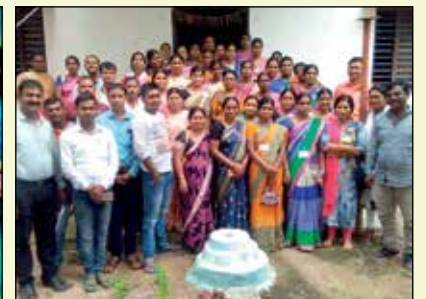
కామారెడ్డి జిల్లాలో బీహార్ బృందం అవగాహన పర్వటన