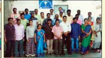
కర్నూలు ఎఫ్ పి సి డైరెక్టర్లకు శిక్షకుల శిక్షణ