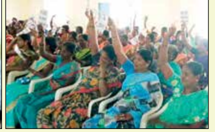
అజీవ మహిళా ఎఫ్ పి సి ట్యూటీయల్ వార్షిక మహాసభ