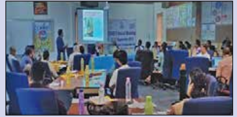
హైదరాబాద్ మాస్ కార్యాలయంలో 'ఎనేబుల్' రెండు రోజుల వర్క్‌షాప్ దృశ్యాలు