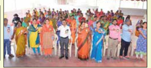
ధీశాలి మహిళా ఎఫ్ పి సి ట్యూటీయల్ వార్షిక మహాసభ