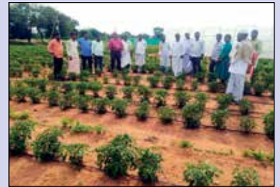
మాస్ - అపార్డ్ సంయుక్త బృందం పరిశీలన దృశ్యాలు