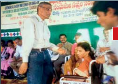
కమిట్మెంట్స్ సమావేశంలో దివ్యాంగులతో ఆత్మీయంగా...