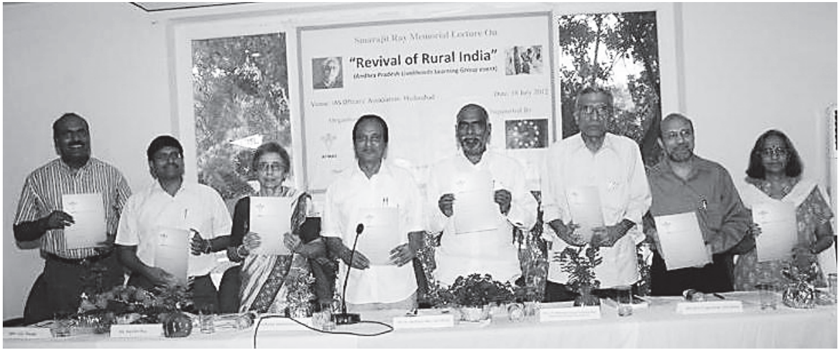
ఏపిమాస్ పదవ వార్షికోత్సవం సందర్భంలో ....