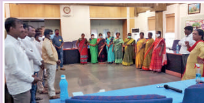
ధరణి, ఆజివ, భీశాలి, జై కిసాన్ ఎఫ్ పి సి డైరెక్టర్లకు శిక్షణ