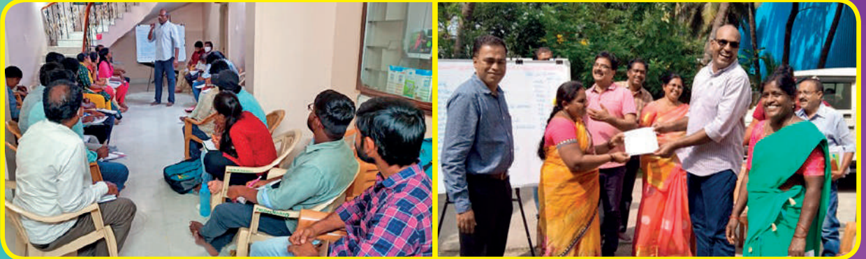
సిబ్బందితో , భాగస్వామ్య ప్రతినిధులతో సమీక్ష .... వాటూదూరులకు షేర్ సర్టిఫికెట్లు అందజేత