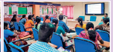
తిరుపతి పశువైద్య కళాశాలలో పశువుల పెంపకంపై శిక్షణ

బట్వాడా కాకపోతే దయచేసి ఈ చిరునామాకు తిప్పిపంపండి