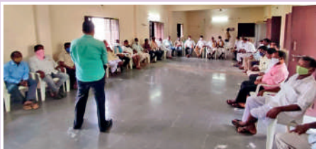
జనగావ్ క్లస్టర్లోని రైతు వికాస్ ఎఫ్ పి సి డైరెక్టర్లకు శిక్షణ