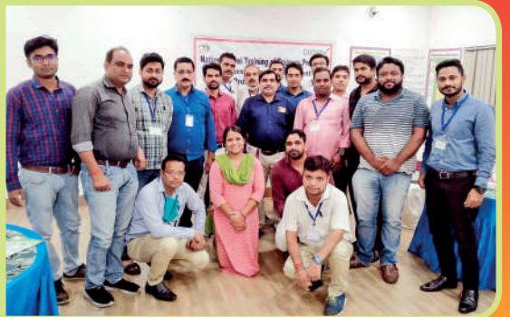
బీహార్ రాజధాని పాట్నాలో 5 రోజులపాటు జాతీయస్థాయి శిక్షకులకు శిక్షణ కార్యక్రమం ... పొల్గొన్న ఉత్తరప్రదేశ్, బీహార్, జార్ఖండ్, పశ్చిమబెంగాల్ రాష్ట్రాల అభ్యర్థులు