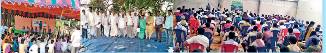
రైతుబడ్డ ఎఫ్ పి సి, సిరికొండ ఎఫ్ పి సి ప్రథమ వార్షిక మహాసభలు ... పలమనేరు ఎఫ్ పి సి వార్షిక మహాసభ