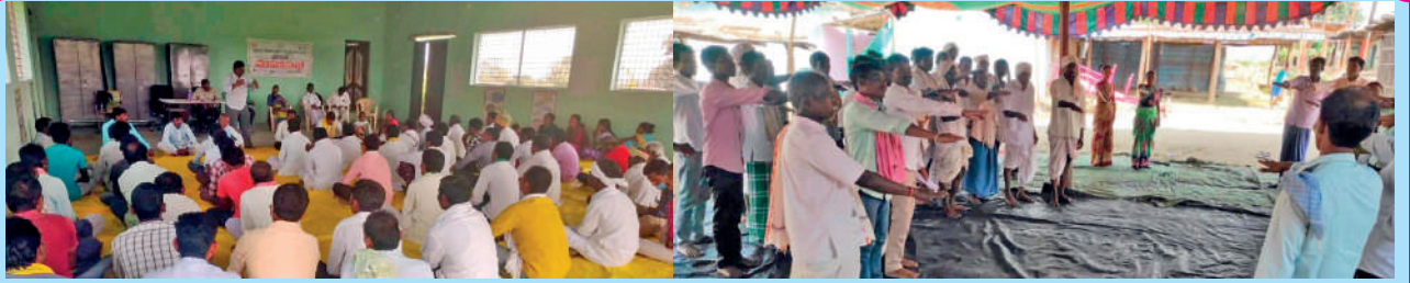
ఆదివాసి గిరిజన ఎఫ్ పి సి, భూసంపద్ ఎఫ్ పి సి ప్రథమ వార్షిక మహాసభల దృశ్యాలు