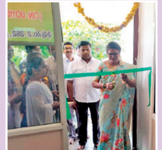
కలకడలో రెడ్డెమ్మ ఎఫ్ పి సి కార్యాలయం ప్రారంభం