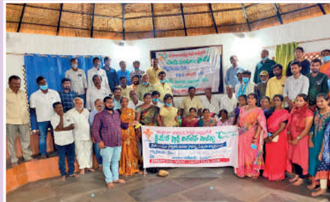
పాడిపంటలు ప్రాజెక్ట్ రైతులు, డైరెక్టర్ల అవగాహన పర్వటన