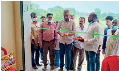
బి కోటలో 'హార్వీ హిల్స్' ఎఫ్ పి సి కార్యాలయ ప్రారంభం