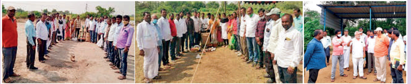
తిమ్మాజివాడి, కల్వరాయిలో 'ధరణి' ధాన్యం సేకరణ కేంద్రాల ప్రారంభోత్సవాలు ... దండువారిపల్లిలో కర్షులు జిల్లా రైతులు