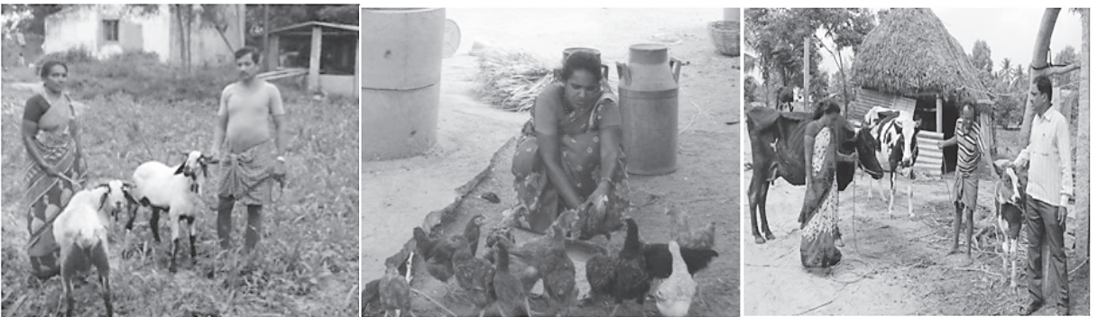
ఒంటరిగా సాధించేవి కొన్నే కలిసి సాధించేవి అన్నీ

ఈ లెక్కన ఈ సంవత్సరంలో ఇప్పటివరకు 32,000 రూపాయల ఆదాయం వస్తుంది. ఆవు పాలను రోజుకు సరాసరి 9 లీటర్లు చొప్పున అమ్ముతున్నాడు. ఈ విధంగా రోజుకు లీటరు పాలకు 22/- రూపాయల చొప్పున నెలకు