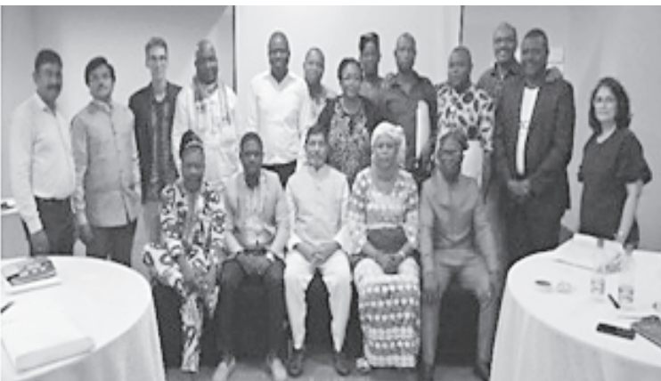
బెనిన్ దేశ బృందానికి హైదరాబాదులో శిక్షణ