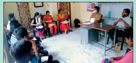
చౌవుదరి పల్లెలో మహిళా రైతు దినోత్సవ దృశ్యాలు .... పీలేరులో ఏపిమాన్ నూతన కార్యాలయం

బట్వాడా కాకపోతే దయచేసి ఈ చిరునామాకు తిప్పింపండి