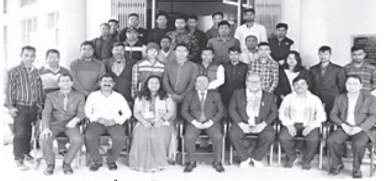
అస్సాంలో నాబార్డ్ ఎఫ్ పి ఓ ల సిబ్బందికి శిక్షణ