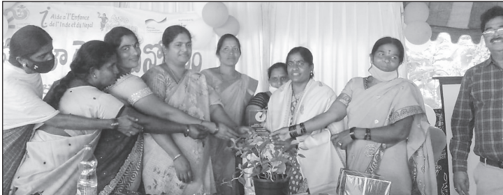
కృష్ణరాధకు మదనపల్లి మహిళా రైతు దినోత్సవంలో సన్మాన ధృత్యం

'హరిత వినూత్న కేంద్ర పథకం తోడ్పాటుతో ఏపి మాస్