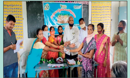
మహిళా రైతులకు సన్మాన దృశ్యాలు: నల్లమాడలో, గుడిబండలో, కామారెడ్డిలో ...