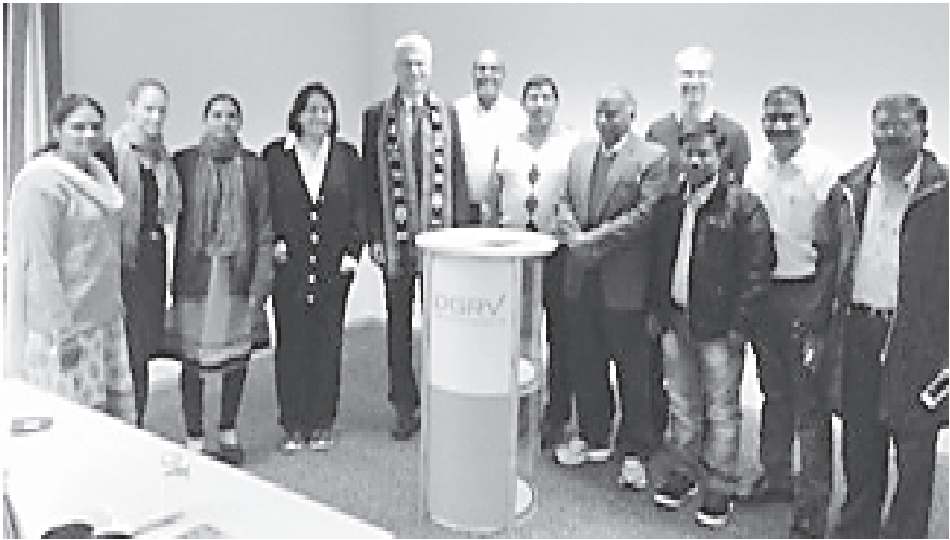
జర్మనీలో అవగాహన పర్యటన