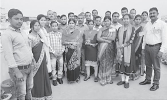
బీహార్ లో బి ఆర్ ఎల్ పి ఎస్ సిబ్బందికి శిక్షణ

వివిధ ఉప కమిటీలపైన, ఇందిరా క్రాంతిపథంలో శిక్షకులకు శిక్షణ కార్యక్రమం, మహిళా సంఘాలు, సమాఖ్యలపైన శిక్షణ పొందారు.