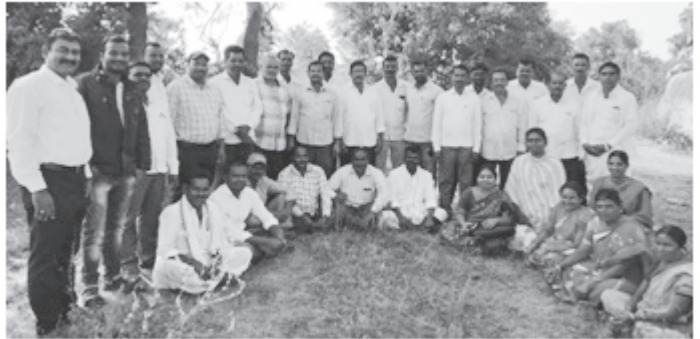
కామారెడ్డిలోని ధరణి ఎఫ్ పి ఓ బోర్డు సభ్యులకు శిక్షణ

⇒ కామారెడ్డిలో పర్యవేక్షణ సమాఖ్య ఏర్పాటు అనంతరం “స్వయం నియంత్రణ ఉద్యమం” లో భాగంగా సొంత కార్యకర్తలను ఏర్పాటుచేసే క్రమంలో ఎన్నో శిక్షణలు ఇచ్చి, ఉద్యమానికి తన వంతు సహకారం అందించారు. పర్యవేక్షణ సమాఖ్యను జాతీయ గ్రామీణ మిషన్ తో అనుసంధానించే భాగస్వామ్య ఒప్పందం కోసం పై అధికారులతో కలిసి పనిచేసి సాధించారు.