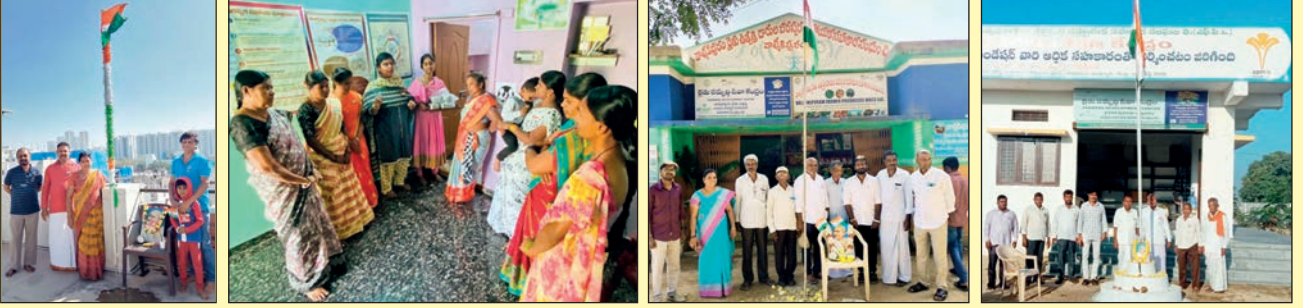
హైదరాబాదులోని ఏపిమాన్ ప్రధాన కార్యాలయంలో ... పెద్దవడుగురులో ... వామీకిపురంలో ... బోర్పట్లలో ...