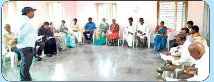
35 మంది ఎఫ్ పి టి - సి ఇ టిలకు శిక్షణానంతర చిత్రం ...జనగావ్లో ఎఫ్ పి టిల పాలకవర్గ సభ్యులకు శిక్షణ