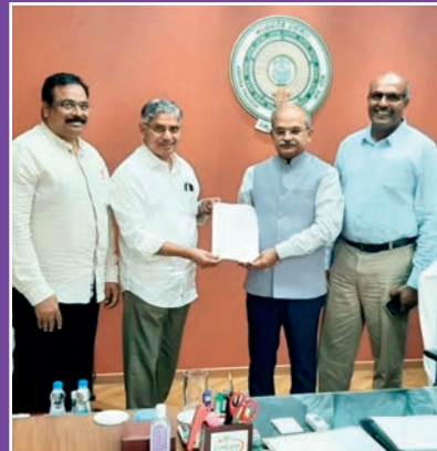
ఏపీ ప్రధాన కార్యదర్శికి వినతిపత్రం