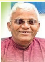
సిలిథాన్యాల ఖాదర్ వలీకి పద్మశ్రీ

ఫుడ్ ప్రొసెసింగ్, సహకార శాఖ మంత్రివర్గులు)