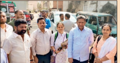
ఏ పి ఎఫ్ బృందం సమీక్షా సమావేశం ... మామిడి రైతులకు శిక్షణ ... కారవాన్ ఎంఎల్ ఏ తో పోషకాహార ప్రాజెక్ట్ బృందం