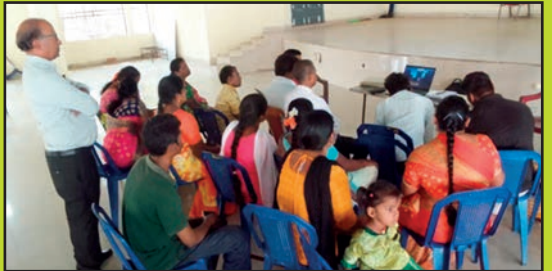
హుజూర్ నగర్ లో దివ్యాంగుల సంఘాలతో ...

బట్వాడా కాకపోతే దయచేసి ఈ చిరునామాకు తిప్పింపండి