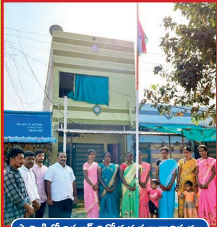
పామిడిలో రిపబ్లిక్ దినోత్సవ పతాకావిష్కరణ