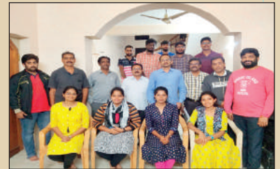
మదనపల్లిలో ఎఫ్ ఎఫ్ ఎన్ బృందానికి శిక్షకులకు శిక్షణ