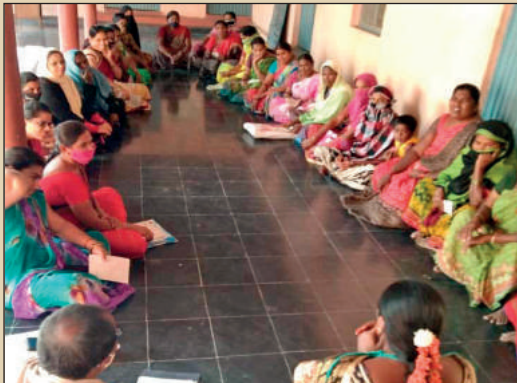
కనిగిరిలో ఎస్ ఎల్ ఎఫ్ సమావేశం