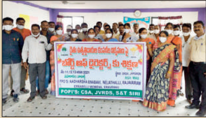
జనగావ్లో ఐదు ఎఫ్ పి ఓల డైరెక్టర్లకు శిక్షణ ... ములకనూర్, భీశాలి ఎఫ్ పి ఓ డైరెక్టర్ల సమావేశాలు