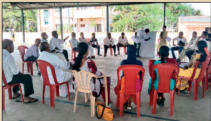
కలికిరి, రామసముద్రం ఎఫ్ పి ఓ డైరెక్టర్ల సమావేశాలు .ఓ.పుంగనూరులో ఏపిమాన్, ఎఫ్ పి ఓ సిబ్బందికి జెండర్ వర్క్ షాప్