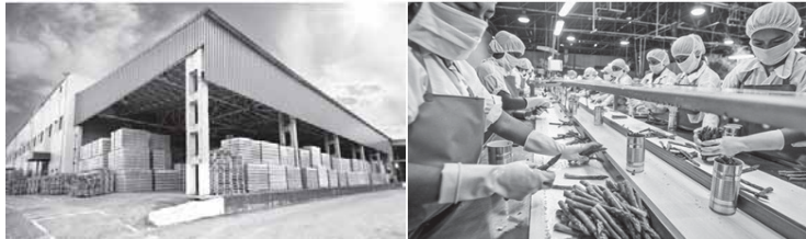
గోదాము ... మైక్రో ఫుడ్ ప్రాసెసింగ్

పెంపొందించి వ్యవస్థీకృత రంగంలోకి ప్రవేశించేలా చూడడమే ఈ పథకం ఆశయం. ఏదైనా మైక్రో ఎంటర్ప్రైజ్ ను ఏర్పాటుచేయడానికి ఒక లక్ష నుంచి గరిష్ఠంగా 25 లక్షల రూపాయల వరకు రుణం సమకూరుతుంది. చిరు ఆహార ప్రాసెసింగ్ యూనిట్ల ఏర్పాటు, పంటకోత తర్వాత నిర్వహించే కార్య కలాపాలు / శుభ్రం చేయడం, గ్రేడింగ్, వాక్సింగ్, ప్యాకింగ్, గుజ్జు, జ్యూస్ తయారీ, ఊరగాయలు, స్నాక్స్ లు, సాస్ లు, పిండి మరపట్టడం, నూడుల్స్, తేనె, చిప్స్ తయారీ, సుగంధ ద్రవ్యాలను మరపట్టడం మొదలైన ప్రాథమిక ఉత్పత్తుల విలువ పెంపు కార్యకలాపాలను నిర్వహించే వ్యక్తులు, ఎఫ్ పి ఓ లు, ఎస్ హెచ్ జి లు, జె ఎల్ జి లు, రైతు సమూహాలు, యాజమాన్య సంస్థలు,