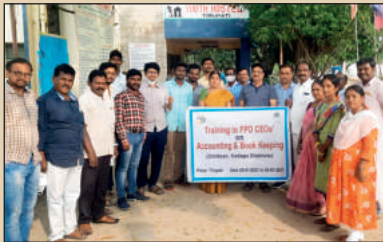
నాబార్డ్ ఆధ్వర్యంలోని కడప, బిత్తూరు ఎఫ్ పి ఓ ల సి ఇ ఓలకు శిక్షణ ...