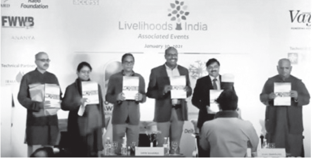
ఏపిమాస్ కేస్ స్టడీల సంకలనం 'అనుభవ్' ఆవిష్కరణ దృశ్యం

2021 జనవరి 28-30 తేదీలలో ఢిల్లీలో జరిగిన 'లైవ్లిహూడ్స్ ఇండియా' సమ్మిట్ ఏపిమాస్ 20 వసంతాల విజయ ప్రస్థానానికి అత్యీయ అభినందన వేదికగా మారింది. 29 వ తేదీన ఏపిమాస్ టమాట విలువ గొలుసు అభివృద్ధికి సంబంధించి, పంట ఉత్పత్తిలో నవీకరణలు, ప్రాసెసింగ్ లో నవీకరణలు, మార్కెట్ అనుసంధానాలు అనే రెండు సదస్సులను నిర్వహించింది. తన 20 ఏళ్ళ అభివృద్ధి సేవారంగ ప్రస్థానంలో తన భాగస్వాములతో కలిసి పనిచేయడంలో పొందిన, ఎదురైన, తోటివారికి అనుభవంలోకి వచ్చిన వివిధ అనుభవాల సారంగా ' అనుభవ్ ' పేరిట ఒక కేస్ స్టడీల సంకలనాన్ని ఏపిమాస్ ప్రచురించింది. ఈ సంకలనాన్ని 'లైవ్లిహూడ్స్ ఇండియా' సమ్మిట్ వేదికగా 30 వ తేదీన ఆవిష్కరించారు.