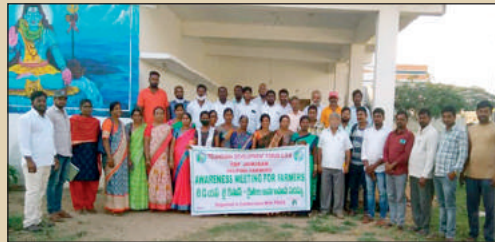
'పీస్' సంస్థ యాదాద్రి బృందం ధరణి ఎఫ్ పి ఓ కు అవగాహన పర్యటన దృశ్యం