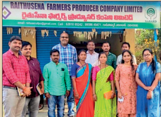
ఆదిలాబాద్ జిల్లాలో శ్రీ సి ఎస్ పర్వటన దృశ్యం