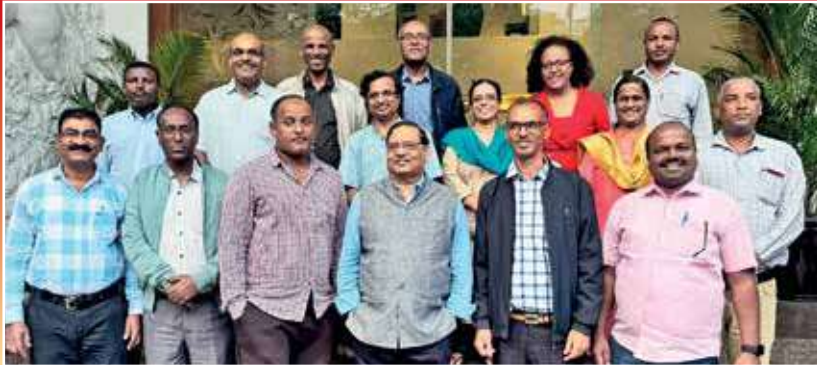
అవగాహన పర్యటన సమన్వయ సంస్థ ఏపిమాస్ బృందంతో ఇథియోపియా బృందం