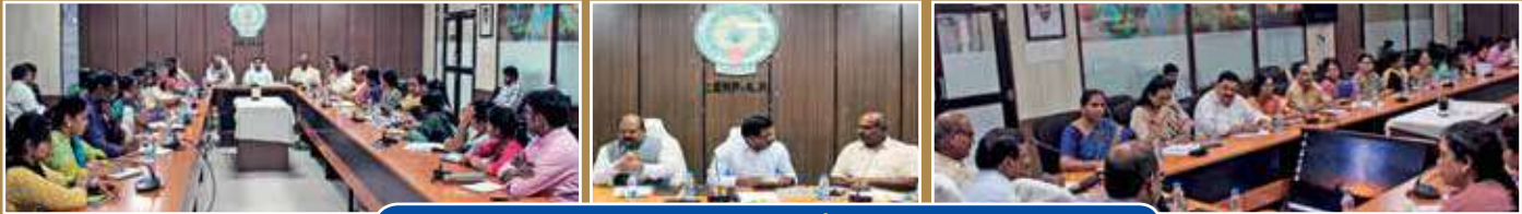
సమాఖ్యలకు సవజీవన కల్పనపై సమాలోచనలు ... మరికొన్ని దృశ్యాలు