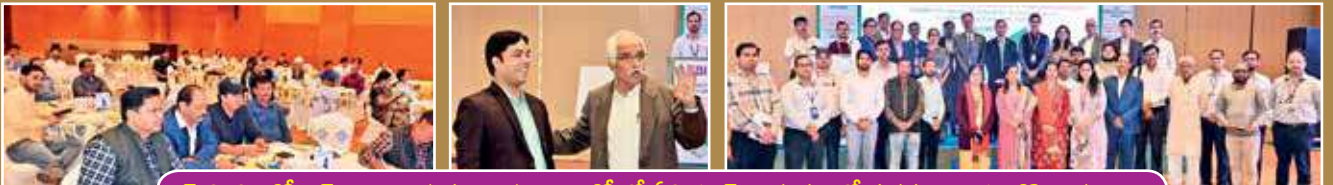
ఎఫ్ పి ఓలతో ఎస్ బి అనుసంధానంపై లక్నోలో ఏపిమాస్ ఆధ్వర్యంలో సదస్సు ... మరికొన్ని దృశ్యాలు