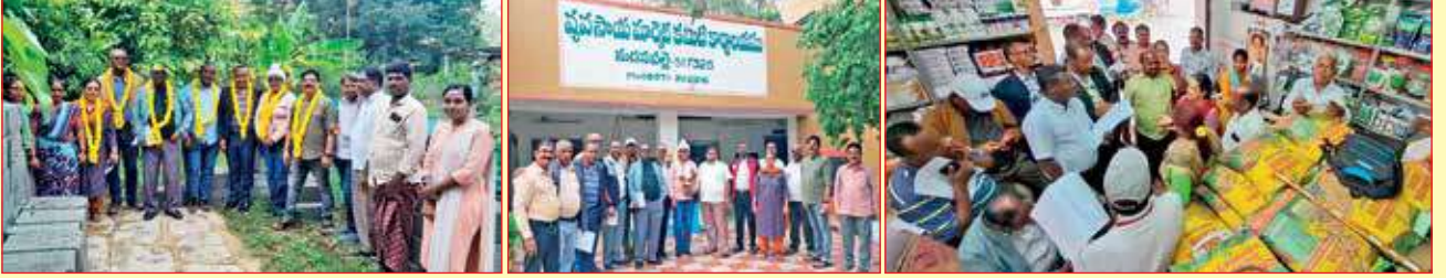
ఆంధ్రప్రదేశ్ లోని మదనపల్లి ప్రాంతంలో ...