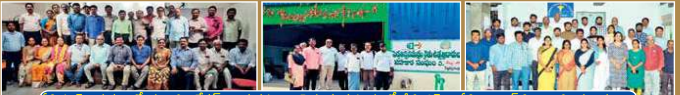
ఏపిమాస్ నిర్వహణలో 'ధ్వని ఫౌండేషన్' కార్యక్రమం ... పెదతిప్ప సముద్రంలో శ్రీ సి ఎస్ ... ఏపి నాబార్డ్ సి బి ఓలకు శిక్షణ