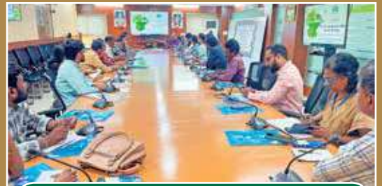
హైదరాబాదులో నాబార్డ్ ఏపి సమీక్షా సమావేశం

బట్వాడా కాకపోతే దయచేసి ఈ చిరునామాకు తిప్పింపండి