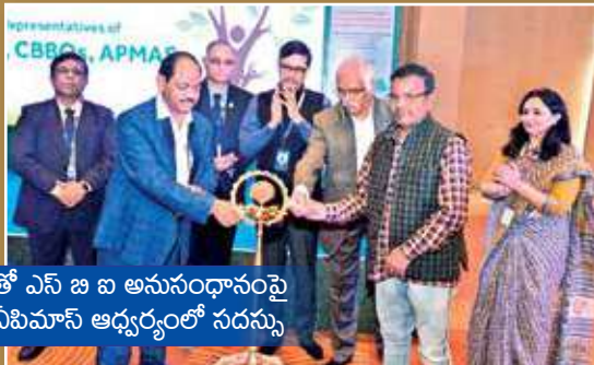
ఎఫ్ పి ఓలతో ఎస్ బి అనుసంధానంపై లక్నోలో ఏపిమాస్ ఆధ్వర్యంలో సదస్సు