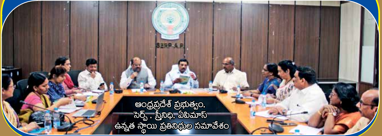
ఆంధ్రప్రదేశ్ ప్రభుత్వం, సెర్స్, స్ట్రీనిభి, ఏపిమాస్ ఉన్నత స్థాయి ప్రతినిధుల సమావేశం