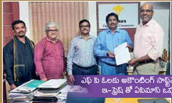
ఎఫ్ పి ఓలకు ఆకౌంటింగ్ సాఫ్ట్వేర్ ఏర్పాటుపై ఇ-ఫ్రెమ్ తో ఏపిమాస్ ఒప్పందం