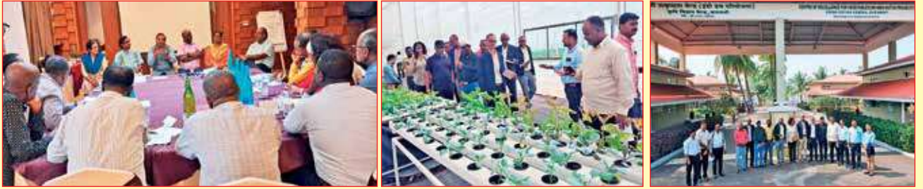
కర్ణాటక రాజధాని బెంగళూరులో ... మహారాష్ట్రలో...