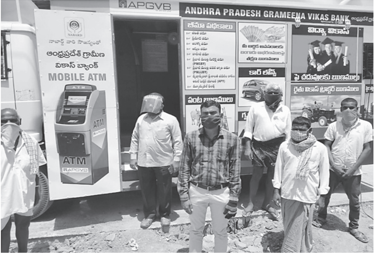
కోవిడ్-19 లాక్ డౌన్ సమయంలో తెలంగాణలోని మారుమూల గ్రామాలలో నేవలందిస్తున్న మొబైల్ ఏ టీ ఎం వ్యాన్లు

నాబార్డ్ తన లక్ష్యానికి అనుగుణంగా ఆర్థిక అక్షరాస్యతను, బ్యాంకులకు సంబంధించిన వివిధ పథకాలపై అవగాహనను విస్తరింపజేయడంలో గ్రామీణ ప్రాంతాలలోని బ్యాంకులకు నిరంతరం తోడ్పాటు అందిస్తున్నది. ఆర్థిక అక్షరాస్యతతోపాటు ప్రాంతీయ గ్రామీణ బ్యాంకులు (ఆర్ ఆర్ బి లు), గ్రామీణ సహకార బ్యాంకులు, నిర్ణీత వాణిజ్య బ్యాంకులు (ఎస్ సి బి లు) సి బి ఎస్ + సాంకేతిక పరిజ్ఞానాన్ని సమకూర్చుకోవడానికి, ఇ-ఫైనాన్స్ నియంత్రణ స్థాయికి తమ సామర్థ్యాన్ని పెంపొందించుకోవడానికి నాబార్డ్ తోడ్పడింది.