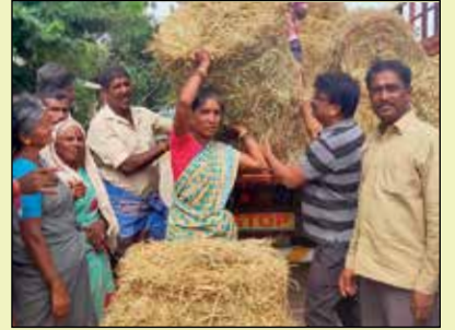
ముదరందోడ్డి వాటర్షెడ్లో మాన్ నేతృత్వంలో ఏర్పాటుచేసిన వనరులను పంచాయతీలకు అప్పగింప దృశ్యాలు