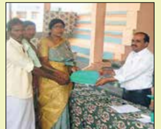
రామసముద్రం వాటర్షెడ్లో మాన్ నేతృత్వంలో ఏర్పాటుచేసిన వనరులను పంచాయతీలకు అప్పగింప దృశ్యాలు