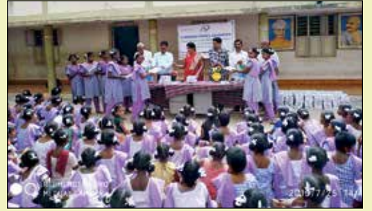
పీలేరు నుంచి బెంగుళూరుకు అవగాహన పర్కటన్ - అరబిందో తోడ్కొంటూ పీలేరు విద్యార్థులకు నోట్ పుస్తకాల పంపిణీ