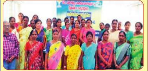
ఆలేరు ఎఫ్ పి ఓలు