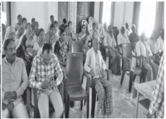
పాత స్నేహం బంగారం, కొత్త స్నేహం వజ్రం; కాని పాత స్నేహితులను మరువరాదు, వజ్రమైనా బంగారంలోనే పొదగాలి