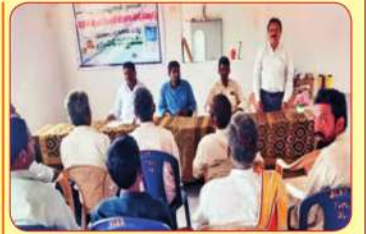
తంబళ్ళపల్లె ఎఫ్ పి ఓలు