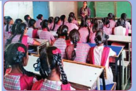
గర్భాశయ క్యాన్సర్ పై అవగాహన