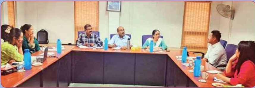
నాగాలాండ్ కు చెందిన ఇ సి ఎస్ సంస్థ సిబ్బందికి ఏపిమాన్ శిక్షణ