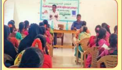
సోమల ఎఫ్ పి ఓలు