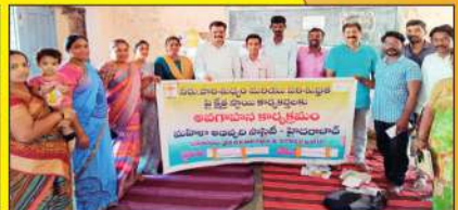
ప్రపంచ నీటి దినోత్సవం : భువనగిరి లో ... మెదక్ లో ... ఖానాపూర్లో 'వాష్' అవగాహన కార్యక్రమం