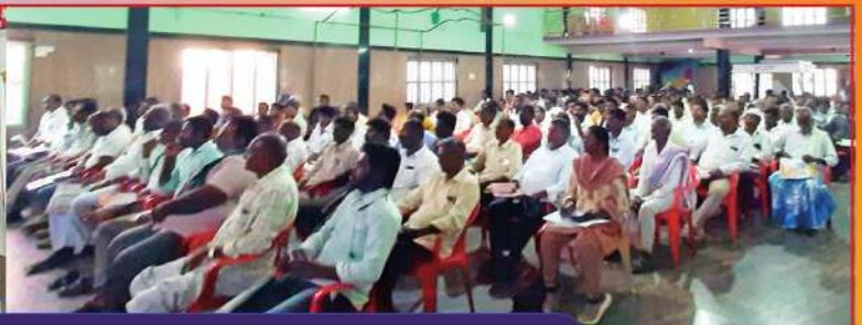
వి కోటలో టమాట సాగు, పంట యాజమాన్య పద్ధతులపై అవగాహన సదస్సు