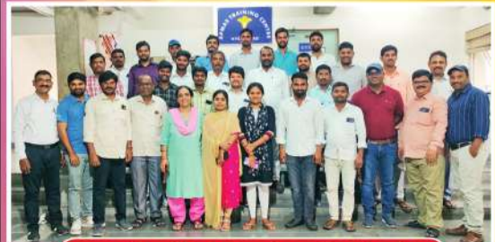
రిలయన్స్ ఎఫ్ పి ఓ - సి క ఓలకు శిక్షణ

బట్వాడా కాకపోతే దయచేసి ఈ చిరునామాకు తిప్పింపండి