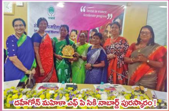
దహిగోన్ మహిళా ఎఫ్ పి సికి నాబార్డ్ పురస్కారం!