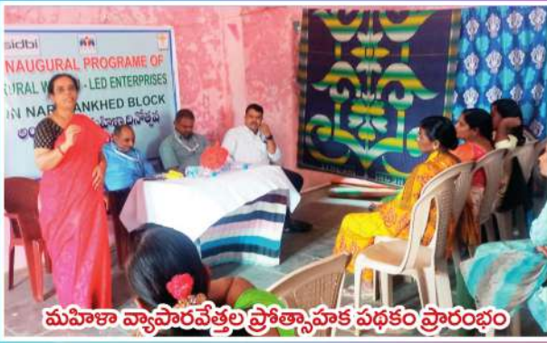
మహిళా వ్యాపారవేత్తల ప్రోత్సాహక పథకం ప్రారంభం