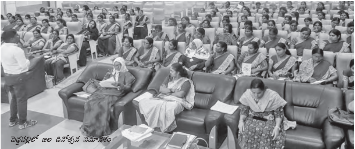
పెద్దపల్లిలో జల దినోత్సవ సమావేశం

◆ సుసంపన్నమైన సుస్థిర భవిష్యత్తుకోసం అందరం జల రంగంలో శాంతియుత సహకారానికి కృషి చెయ్యాలి.