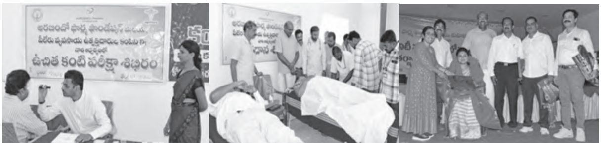
ప్రగతికి పునాది నమ్మకం కాదు, సందేహం

వివిధ శాఖల జిల్లా , మండల స్థాయి అధికారులను సన్మానించడంతో సమావేశం విజయవంతంగా ముగిసింది.