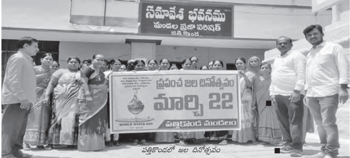
పత్తికొండలో జల దినోత్సవం

ప్రపంచ జల దినోత్సవం (మార్చి 22 వ తేదీ) సందర్భంగా వాష్ ప్రాజెక్ట్ ప్రతినిధులు ఆంధ్రప్రదేశ్, తెలంగాణ రాష్ట్రాలలో ప్రాజెక్ట్ అమలు జరుగుతున్న జిల్లాలలోని సంబంధిత మెప్పా, సెర్ప్ సిబ్బందితో కలిసి నీటి వినియోగంపై అవగాహన కార్యక్రమాలు నిర్వహించారు. అందులో భాగంగా మెప్పాకు చెందిన రిసోర్స్ పర్సన్స్, సెర్ప్కు చెందిన వి ఓ ఏ లకు ప్రపంచ జల దినోత్సవం ఆవశ్యకతను, 2024వ సంవత్సరం జల దినోత్సవం నినాదాన్ని (వాటర్ ఫర్ పీస్) వివరించి, నీటి వనరులను పరిరక్షించడంలో సామాజిక బాధ్యతను గుర్తు చేశారు. అందుకోసం ప్రతి కుటుంబం అవలంబించవలసిన పద్ధతులను ముఖ్యంగా ఇంకుడు గుంతలు, వర్షపు నీటి సంరక్షణ నిర్మాణాలు (రూఫ్ టాప్ రెయిన్ వాటర్ హార్వెస్టింగ్ ట్రక్చర్స్) మొదలైన అంశాలు వివరించి, వారి సందేహాలను తీర్చారు.