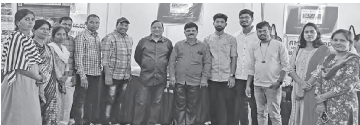
పుస్తకాలు లేని గది అత్తలేని శరీరం లాంటిది