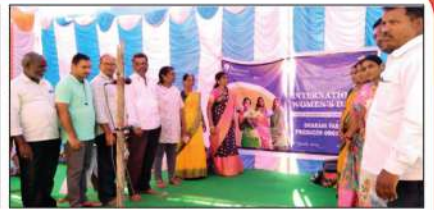
మహిళా దినోత్సవాలు : హైదరాబాదులో పట్టణ పోషణ పథకంచే ... నల్లమడలో ... ధరణి ఎఫ్ పి ఓలో ...